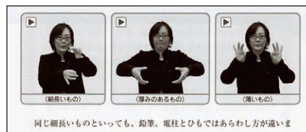
同じ細長いものといっても、鉛筆、電柱とひもではあらわし方が違います

※1機種によっては閲覧できない場合があります。閲覧にはパケット通信料がかかります。